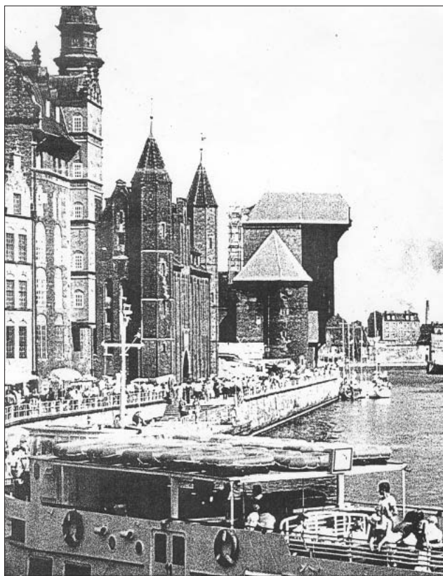
Hafen in Danzig mit dem Krantor