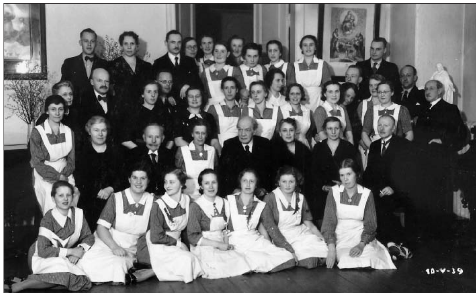
Schwestern, Verwaltungsangestellte und Ärzte der Mellin'schen Klinik in Dorpat/Tartu 1939